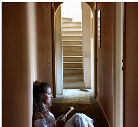
Foto 1: mujeres, seres sensibles, débiles e insensatos por sentir.

No es un tema de ignorancia en que las mujeres tienen un apego sentimental y poética en cómo analiza y vive su entorno generalmente a mayor nivel que su opuesto, los hombres. La definición de las mujeres como seres débiles e incluso fantasiosos deslinda de cualquier credibilidad a ésta al querer sumergirse a un mundo hecho y conquistado por hombres.