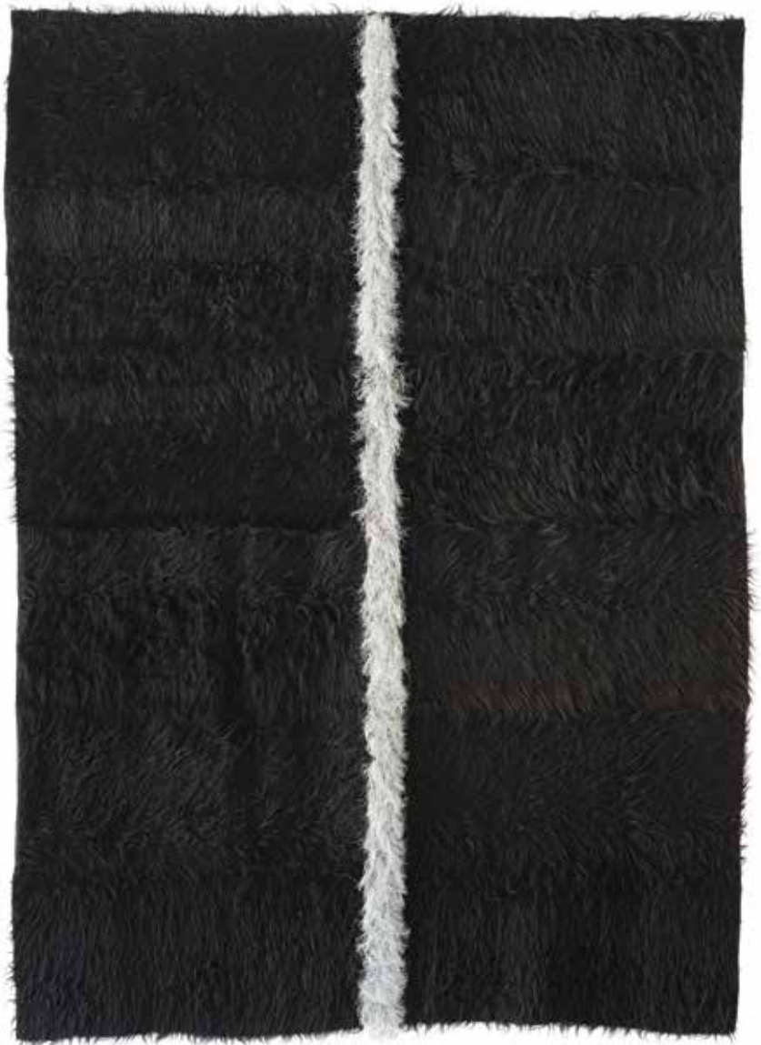
Reflexiones sobre Chamula / Trine Ellitsgaard