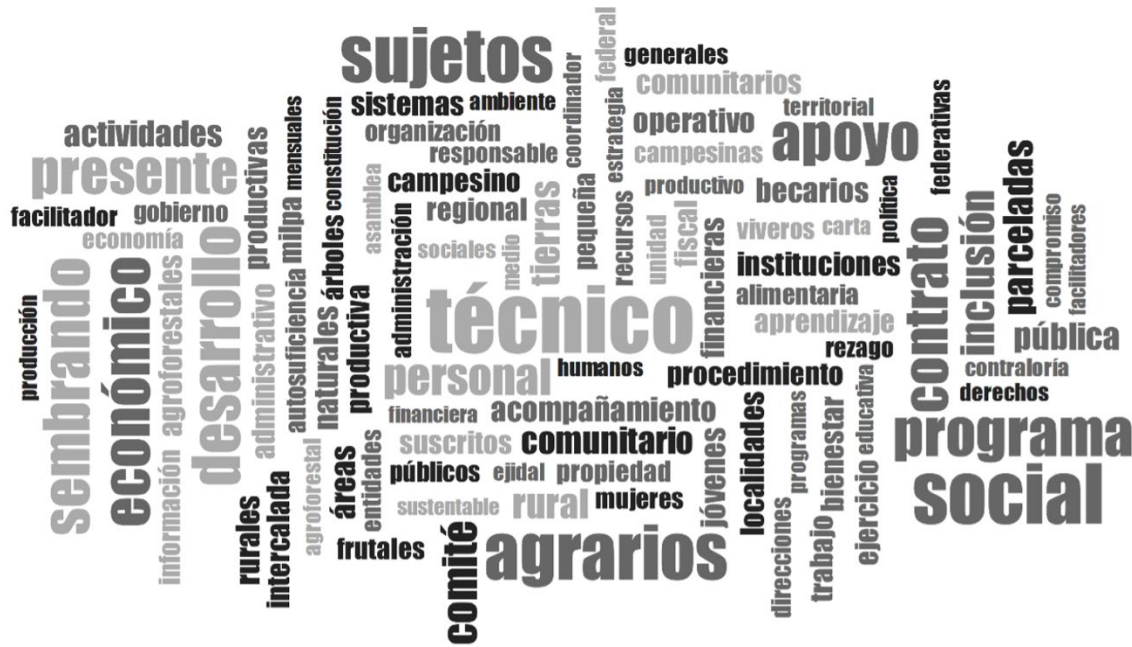
Figura 3. Nube de palabras del programa Sembrando Vida.

En la Figura 3 se muestran en un diagrama de nube de palabras los conceptos más relevantes para el programa Sembrando Vida.