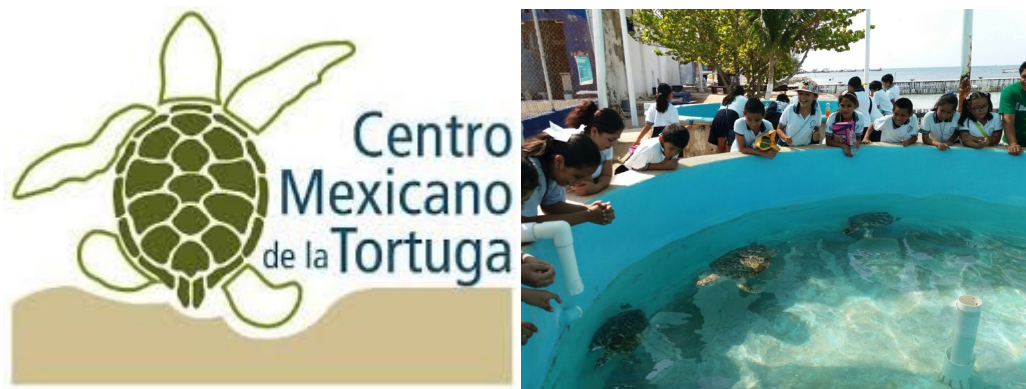
Figura 4. Logo del Centro Mexicano de la Tortuga y exhibición (CMT, 2018).

El CMT tiene a su cargo la operación de los Centros de Protección y Conservación de Tortugas Marinas (CPCTM): La Escobilla, Barra de la Cruz y Morro Ayuta, todos ellos de importancia estratégica para la reproducción de algunas de las especies de tortugas marinas que llegan a nuestro país, los cuales además de difundir distintos aspectos de la conservación de las tortugas marinas, fomentan la actividad turística en la región al contar con instalaciones en las que se exhiben distintas especies en sus diferentes fases de crecimiento (García-Besné, 2021).