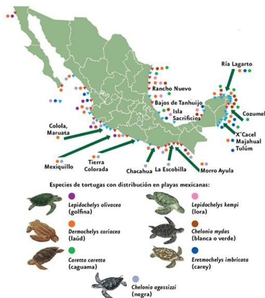
Figura 4. Especies de tortugas marinas y distribución en playas mexicanas (PROFEPA, 2019).