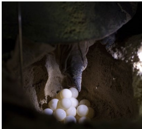
Figura 2. Tortuga hembra depositando sus huevos en una cavidad arenosa (Seaturtle-World, 2015).

Cuando la hembra ha terminado de depositar sus huevos, los cubre con arena y apisona bien el nido. Luego trata de camuflarlo lanzando arena a todo el rededor y balanceando su cuerpo sobre la playa. Después de que la hembra abandona el nido para volver al mar, existe la posibilidad de que los cangrejos y otros animales lo excaven y se coman los huevos (CRAM, 2022).