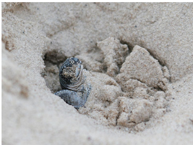
Figura 3. Cría de tortuga laúd a punto de iniciar su recorrido hacia el mar (Seaturtle-World, 2015).

Si los huevos no son destruidos por el agua, o por los depredadores, se incubarán por aproximadamente dos meses. Por lo general, todos los huevos de un nido se incuban al mismo tiempo (CRAM, 2022). Conforme las crías salen de los huevos, empiezan a forcejear para abrirse camino hacia la superficie de la playa; arañan la arena de los lados y de la parte superior del nido (Figura 3), la cual va cayendo en el fondo de éste junto con las cáscaras vacías de los huevos. De esta manera, el fondo del nido se va levantando gradualmente hacia la superficie (Seaturtle-World, 2015).