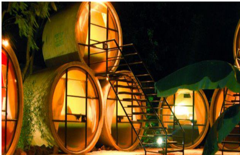
Nombre del autor: Mi Ciudad Cuicacán., título del recurso (brindado por el autor): Tubohotel en Tepoztlán, Morelos, Tipo de Licencia Creative Commons: C. Descripción de la atribución: Todos los derechos reservados, Nombre del sitio web: Flickr.

Biblioteca Vasconcelos en CDMX: es una biblioteca pública y un jardín botánico que funcionara como respiradero para el centro de la ciudad. La biblioteca abrió sus puertas en 2006 y aprovecha la iluminación natural y ventilación de la zona. Más de 26 hectáreas cuadradas cuentan con más de 60 mil ejemplares de 168 especies de árboles, arbustos y plantas.