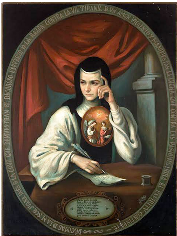
Sor Juana Inés de la Cruz

17 de abril de 1648-20 de noviembre de 1695