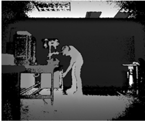
Figura 1. Movimiento del ciclo para buscar una placa.