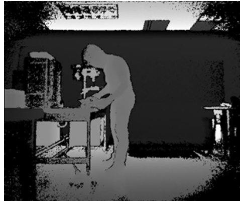
Figura 5. Desplazamiento a la izquierda.