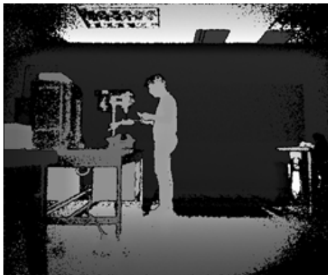
Figura 3. Levantamiento de la placa con ambas manos.