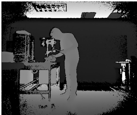
Figura 7. Torsión y flexión lateral del torso.