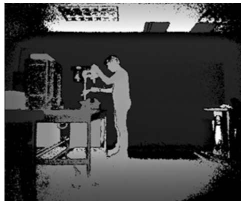
Figura 4. Levantamiento de la carga con un brazo.