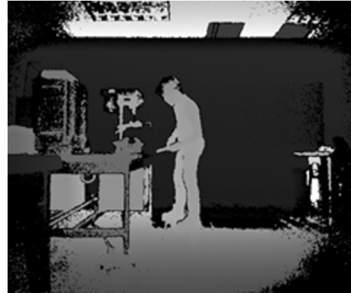
Figura 2. Peso de carga adquirido.