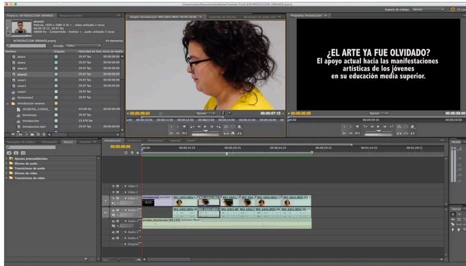
IMAGEN 1 “Edición de documental en sistema Adobe Premiere”