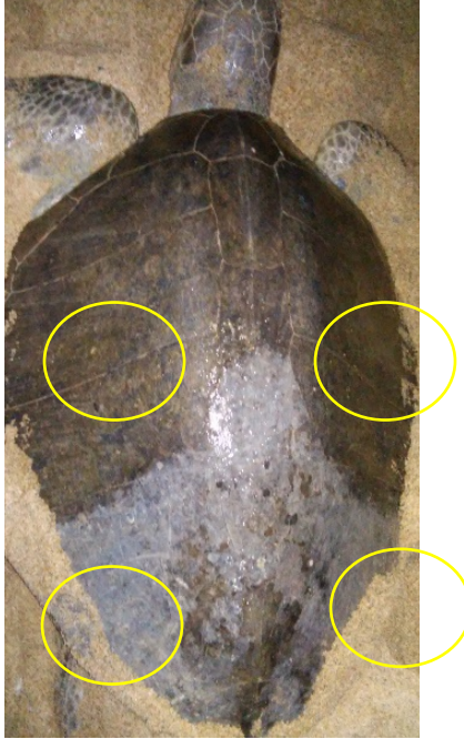
Figura 1. Área para la toma de material biológico sobre el caparazón de las tortugas