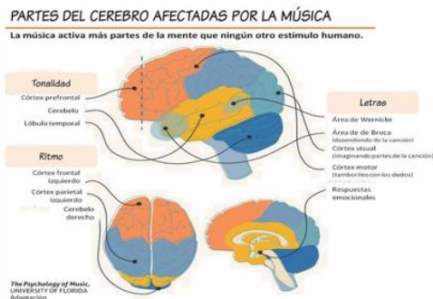
Figura 2 Partes del cerebro afectadas por la música. [4]

Como consecuencia se desarrolla una estabilización de uniones celulares relacionadas con estímulos, así iniciando el principio de aprendizaje, lo que nos permite relacionarnos con el mundo exterior gracias al enlace con la actividad nerviosa producida por diferentes estímulos.