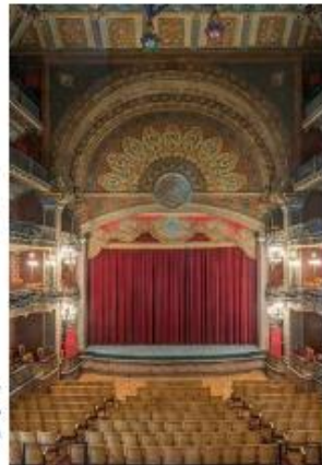
IMAGEN 2: Página del léxico, donde se muestran las primeras palabras por orden alfabético y las correspondientes fotografías de los edificios en Guanajuato.

Arriba. Fachada "Casa de la Presa" Abajo. Escenario en el interior del "Teatro Juárez"