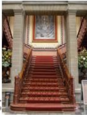
Superior Puerta "Casa de la Poesía" Inferior: Teatro Juárez

Conjunto de escalones o gradas que sirve para comunicar los diferentes pisos de un edificio o los desniveles de terrenos, mediante un acceso permanente y cómodo.