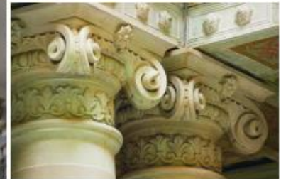
IMAGEN 3: Pagina del léxico, donde se muestran palabras que inician con la letra C, y las correspondientes fotografías de los edificios en Guanajuato.

Superior. Puerta de la iglesia de "Belón" Inferior Izquierda Fachada "Casa de la Presa" Inferior Derecha "Palacio Legislativo"