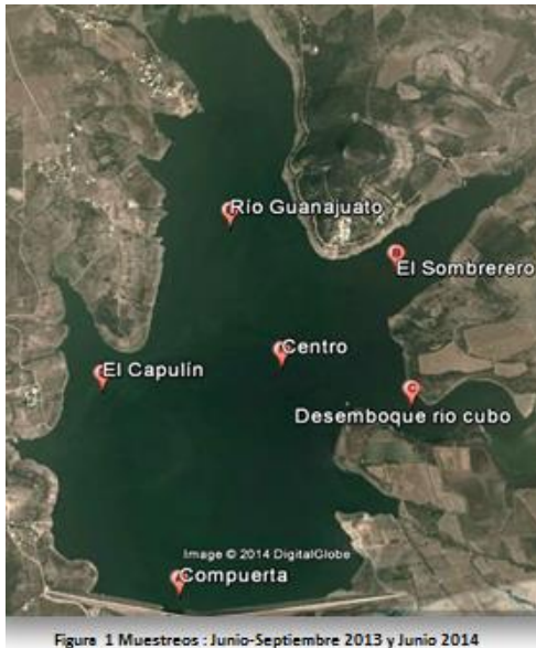
Figure 1 Muestréos : Junio-Septiembre 2013 y Junio 2014

cubo, el capulín y el río Guanajuato, y para La Laguna de Yuriria se tomaron 10 puntos: Coyontle, Characo, La Loma, La Angostura, Maryu, Socupingo, La Cuadrilla, Rancho Viejo, El Granjetal y San Pedro, según la norma NOM-014-SSA1-1993, empleando un GPS GARMIN eTrex® para la ubicación de las zonas.