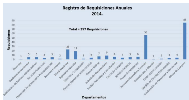
IMAGEN 3: Registro requisiciones anuales por departamento

Esta investigación trajo como resultados una toma de requerimientos precisa que involucra a toda la institución y no solo a un departamento. Se pudo seccionar la actividad que tiene cada departamento dentro del proceso analizando cuantas requisiciones ha emitido a lo largo del año, como se