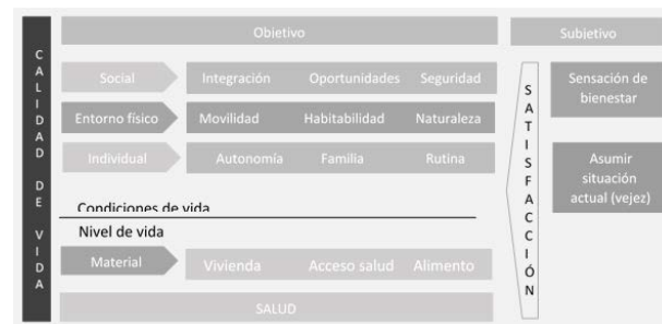
Imagen 2 Dimensiones de la calidad de vida: definición según percepciones de las personas mayores

La definición de calidad de vida en el adulto mayor por los grupos focales entrevistados, se caracteriza por ser multidimensional y, a juicio de los/as entrevistados/as, subjetiva. Dicha subjetividad debe ser entendida desde dos perspectivas: la evaluación de la situación actual (vejez), asumiendo las limitaciones y posibilidades, y la satisfacción frente a dimensiones concretas de calidad de vida (objetivas), satisfacción que encuentra sus puntos de referencia en el contexto social y cultural en que el sujeto se desenvuelve[12].