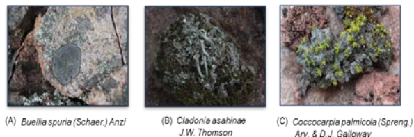
FIGURA 2. Tipos de Líquenes localizados en este trabajo. (A) Líquen costroso localizado en el Cerro de la Bufa y Santa Rosa sitio 1, 2. Foto Violeta Cortez Hernández. (B) Líquen fruticoso localizado en el sitio Santa Rosa 1 Foto: Dulce Noemí Ríos Ureña. (C) Líquen folioso localizado en el Cerro la Bufa y Santa Rosa1 Foto: Dulce Noemí Ríos Ureña.

Poelt , por su ácido pulvínico, también se encuentra Usnea halei P. Clerc con ácido norstictico, salazínico, protocetrárico y usnico este último también es usado como colorante natural. De igual manera también es usada para preparar una pasta que se aplica en las fracturas de los huesos.