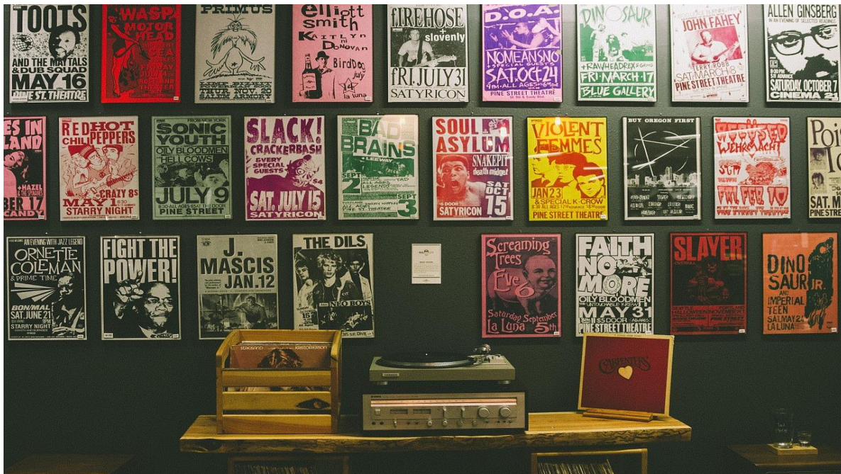
Imagen 3: Los carteles suelen ser una ventana de expresión inusitada