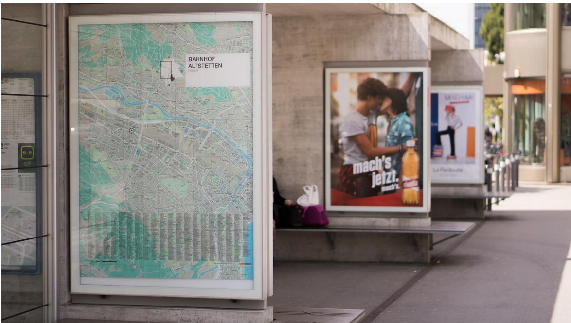
Imagen 2: Existen diferentes usos para los carteles