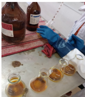
Figura 1. Titulación de Materia Orgánica de tierra degradada. (Elaboración propia)

El criterio para saber si la tierra es degradada o recuperada fue a partir de los autores Gros & Domínguez (1992), el cual en la sección de “Resultados y Discusiones” se habla sobre éste.