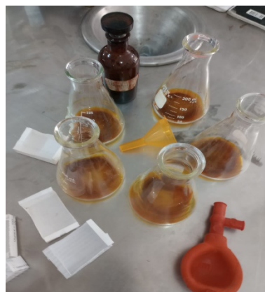
Figura 2. Titulación de Materia Orgánica de tierra recuperada. (Elaboración propia)

Se determinó la cantidad de humedad relativa con método de secado en horno como se observa en la Figura 3, (Jerónimo, 2017).