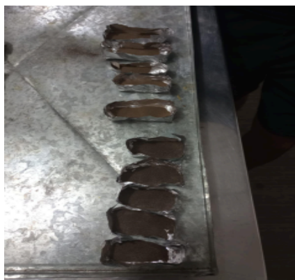
Figura 3. Muestra de tierra con composta y degradada. (Elaboración propia)

Se determinó la cantidad de humedad relativa con método de secado en horno como se observa en la Figura 3, (Jerónimo, 2017).