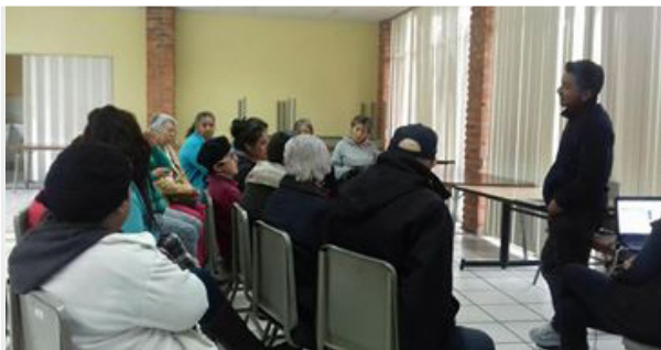
Imagen 1. PLN Nikh Sierra durante exposición a pacientes del albergue Jesús de Nazaret.