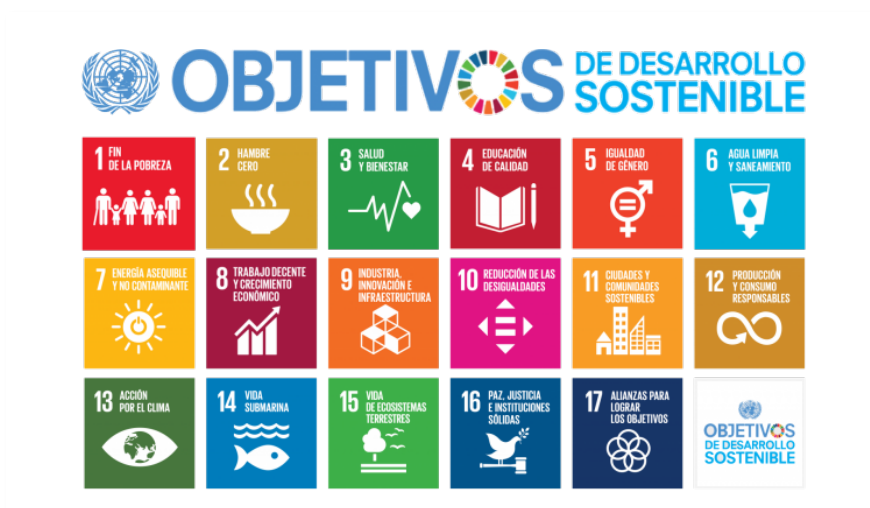
Figura 1. Objetivos de Desarrollo Sostenible.