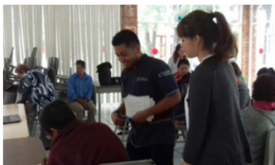
Imagen 2. Encuesta sobre conocimientos en consumo de carnes procesadas.