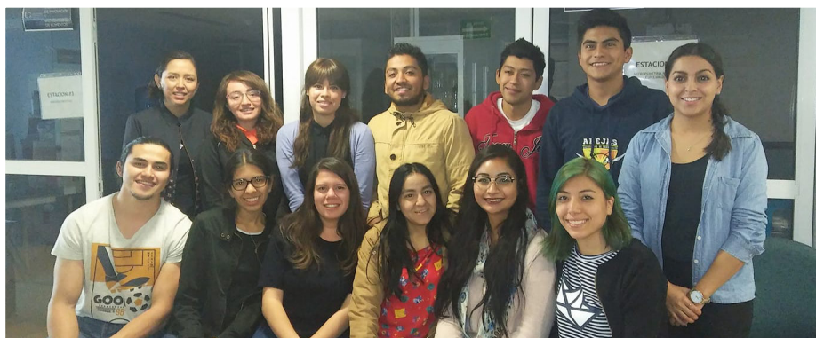
Imagen 1. Alumnos de la Licenciatura en Nutrición del Campus León que inician el Servicio Social Universitario en Investigación.