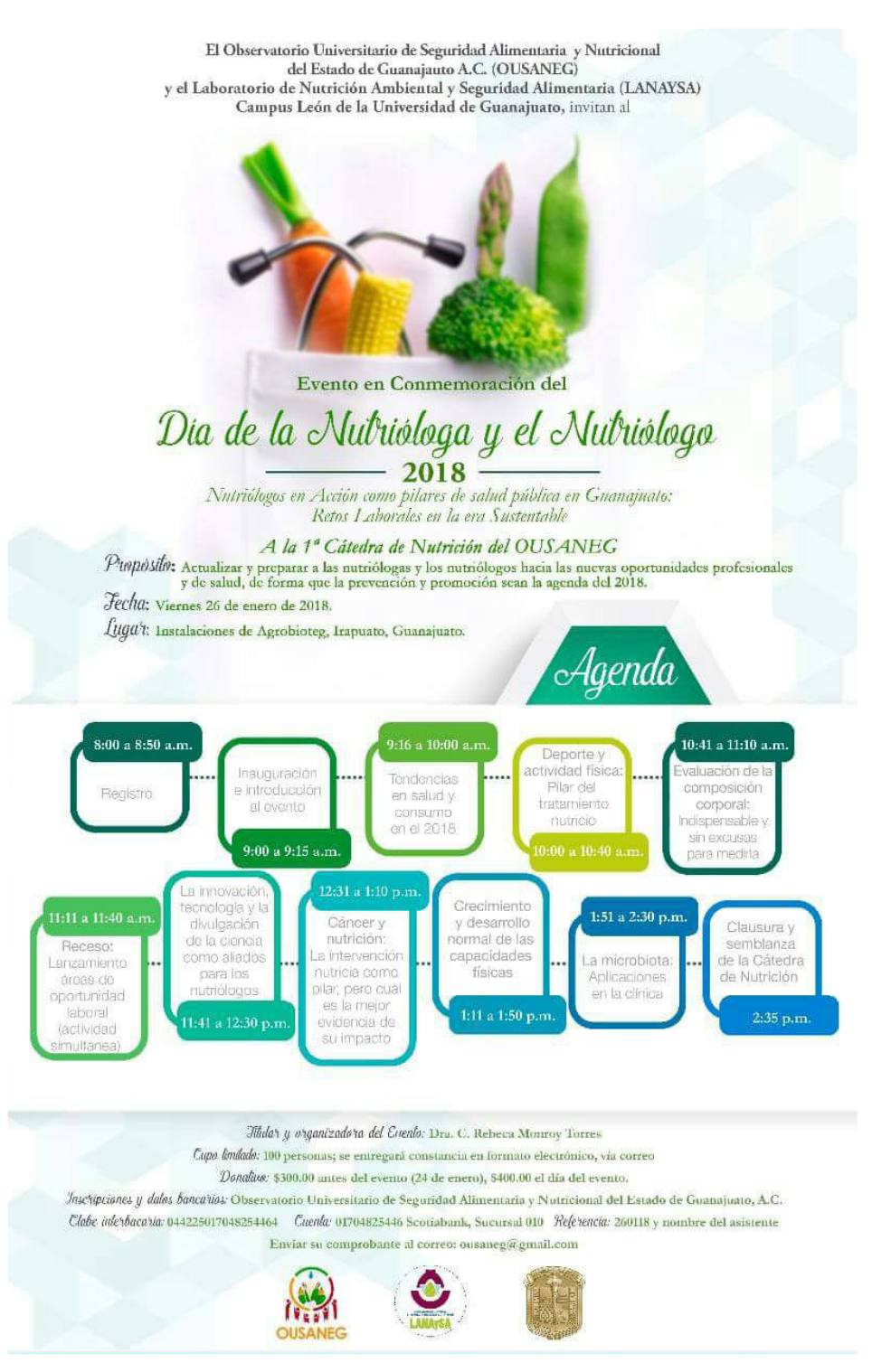
Imagen 3. Poster de promoción para cátedras en conmemoración del día del Nutriólogo.