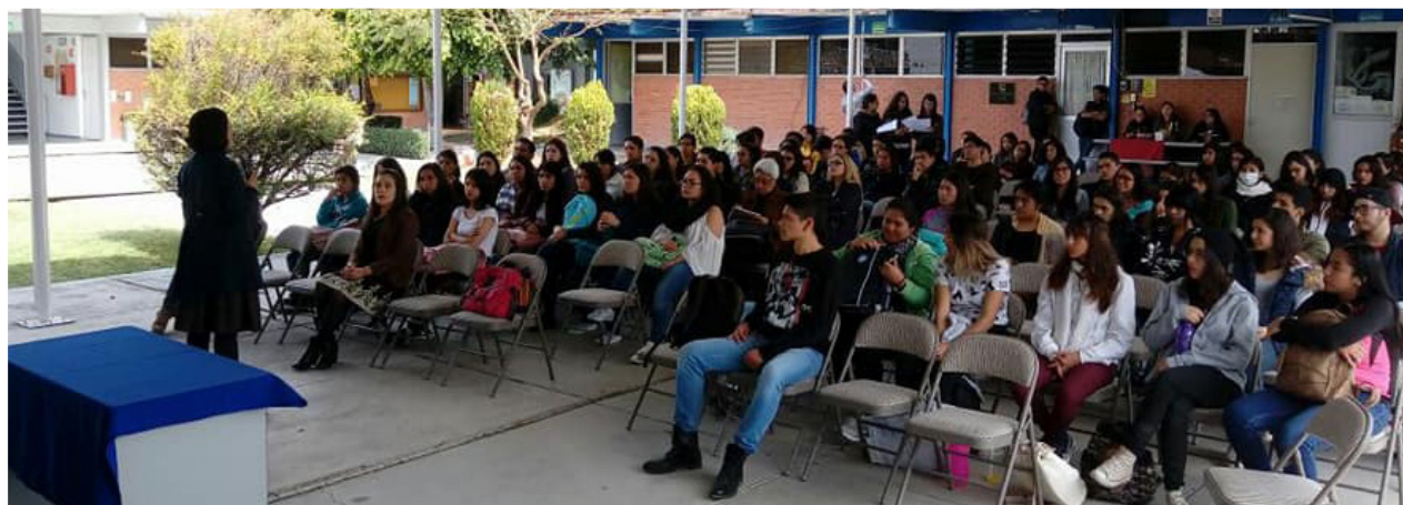
Imagen 1. Ponencia a los alumnos de la Licenciatura en nutrición del campus Celaya-Salvatierra como parte del festejo del día del nutriólogo.