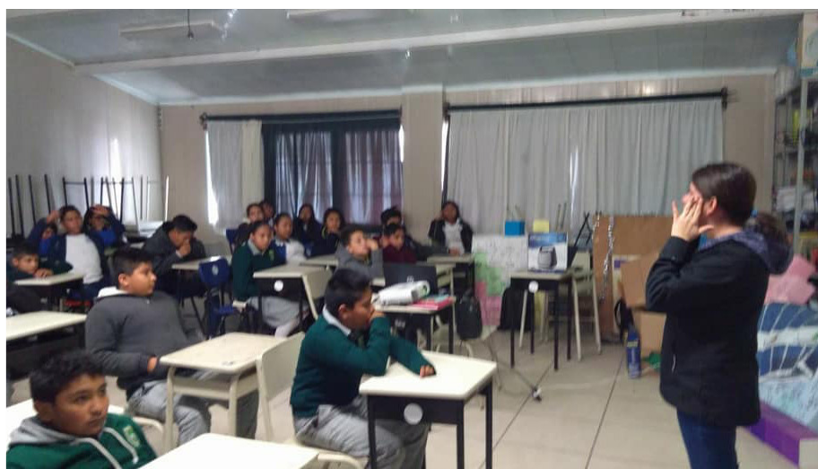
Imagen 3. Alumnos de la secundaria técnica no. 60 de Irapuato.

El objetivo de estas proyecciones es el de generar conciencia en los jóvenes sobre las consecuencias de tener un consumo elevado de azúcares refinados y productos industrializados en la dieta, la falta de una cultura de prevención hacia las enfermedades crónicas y de los problemas que genera la diabetes en la salud de quien la cursa, así como el modo en que afecta a familiares, amigos y a la economía tanto del hogar como del país. Este programa forma parte de las actividades de colaboración con el Observatorio Universitario de Seguridad Alimentaria y Nutricional del Estado de Guanajuato, A.C.