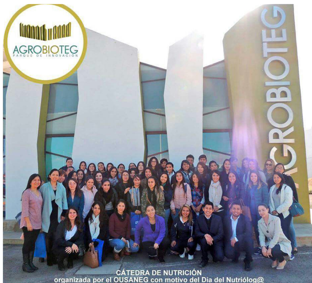
Imagen 4. Asistentes y ponentes de la Cátedra en conmemoración del día del Nutriólogo.