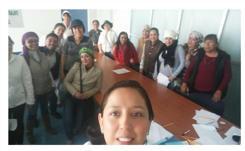
Imagen 1. Participantes del taller de consejería en nutrición en el IMSS UMAE T1.