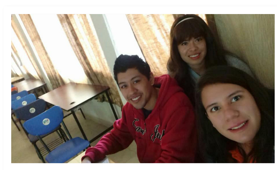
Imagen 2. Miembros del equipo LANAYSA-OUSANEG.