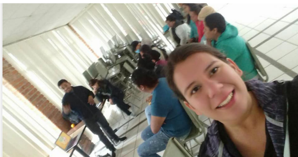
Imagen 3. Talleres de nutrición en el albergue Jesús de Nazareth.